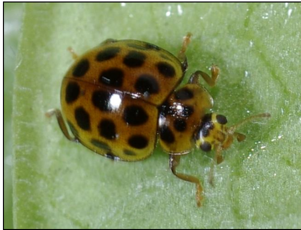
Psyllobora vigintiduopunctata sombre

individus de cette espèce sont toujours jaunes avec des points noirs et cette forme sombre n'a, à notre connaissance, jamais été citée dans une publication et ne figure pas dans les collections du Muséum national d'Histoire naturelle.