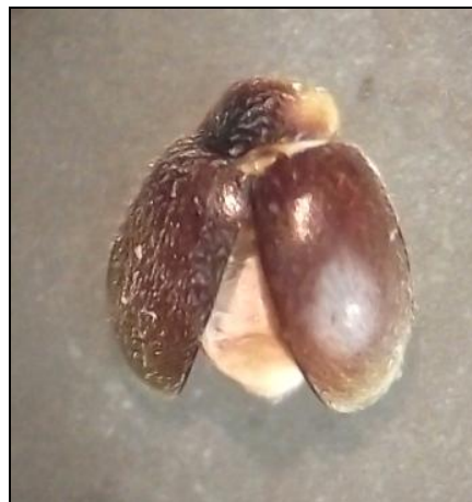
Scymnus fraxini (Tarn)