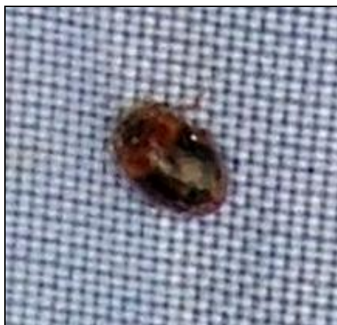
Rhyzobius chrysomeloides (Moselle)