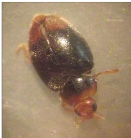
Scymnus fraxini (Haute-Vienne)

Mais l'exemplaire le plus surprenant provient du Tarn (leg. P-O. Cochard). En France, c'est la forme (?) wichmanni Fürsch (décrite comme sous-espèce) qui est représentée selon Gourreau (1974). Celle-ci est noire à motif rouge-orangé. La forme nominale est nettement différente, avec une coloration globale brun à brun jaunâtre et une suture distinctement plus sombre. Ici, l'exemplaire en question possède le motif élytral et pronotal de wichmanni – quoique jaune pâle sur le pronotum, et jaune blanchâtre à l'apex des élytres) – et une coloration brune (plus foncée sur le pronotum) avec la suture nettement obscurcie. La tête, les appendices et les derniers segments abdominaux sont jaunes pâles.