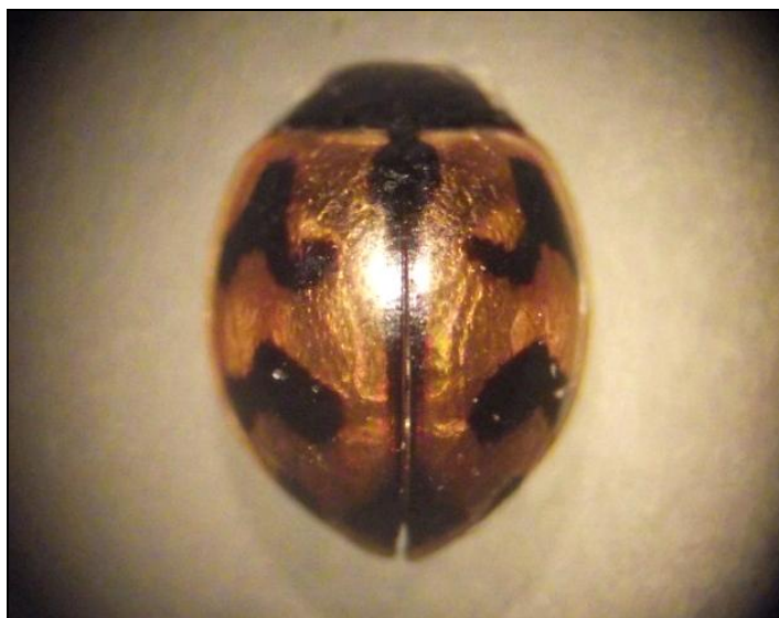
Photographie n°3 : Coccinella transversalis F. 1781, ultime vision de la passion terrestre d'Albert Sicard ?

petite tonkinoise » ? Avait-il été contacté par Lucien Chopard ou Paul Vayssière 4 afin d'aider aux préparatifs, en grande pompe, de la séance solennelle du Centenaire de la Société entomologique de France ? 5 Mourait-il apaisé d'avoir prévu sa dernière demeure (photo n° 4) et assuré le devenir de sa bibliothèque et de sa très riche collection ?