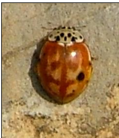
Harmonia quadripunctata (Corrèze)

Les variétés sombres de R. chrysomeloides ne sont pas rares dans certaines régions, voire localement dominantes. L'exemplaire des Vosges mosellanes figuré ici est la forme la plus mélanique qu'il m'ait été donné d'observer.