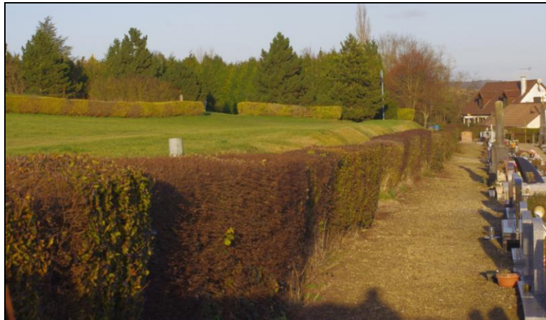
Environs du cimetière de Daours (80)

Afin de compléter les inventaires entomologiques effectués sur la commune de Daours (80), une recherche aux environs du cimetière de cette commune fut programmée le 1 er décembre 2013. Nous avons remarqué au cours de cet été que quelques pieds de Bryone ( Bryonia dioica ) se développaient au niveau d'une haie (composée de troène, orme, houx...) ceinturant ce cimetière communal et nous espérons enfin trouver Henosepilachna argus (Geoffroy), la coccinelle inféodée à cette plante.