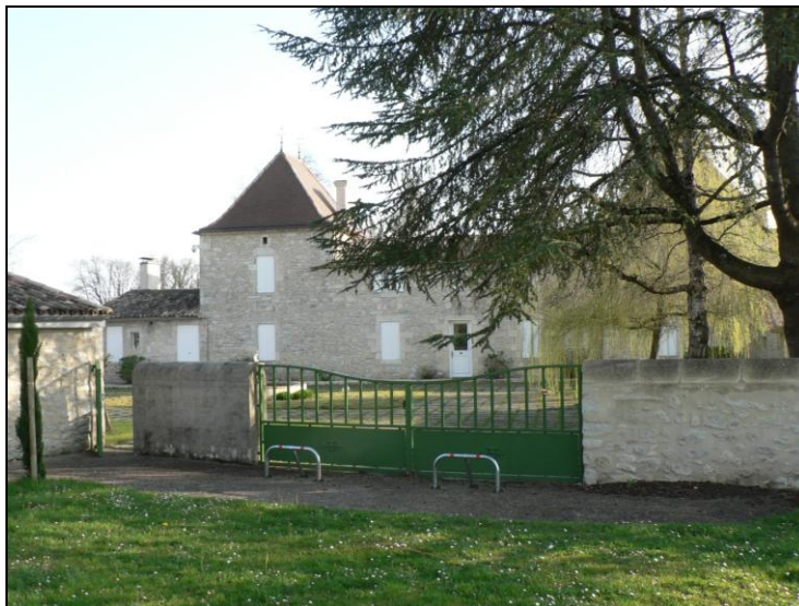
Photographie n° 2 : la maison familiale d'Albert Sicard à « Lafont » (Commune de Saint-Vivien en Dordogne) (Photo Michel Secq, mars 2014)