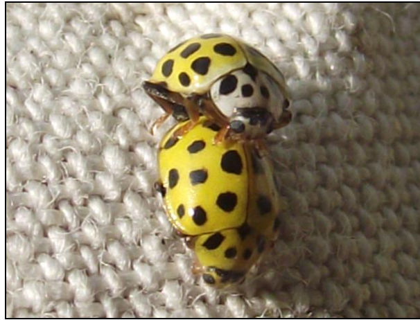
Psyllobora vigintiduopunctata (Haute-Vienne)

des populations. Espérons simplement que le porter à connaissance de ce caractère jusque là ignoré encouragera les prospecteurs à se pencher plus attentivement sur ces taxons « banals ».